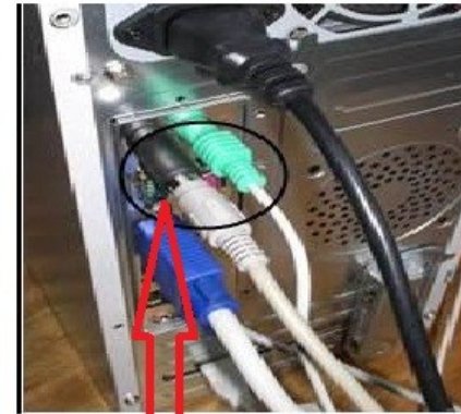
WITH PS2 KEYLOGGER