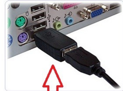
WITH USB KEYLOGGER